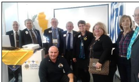
Avec les organisateurs du Forum